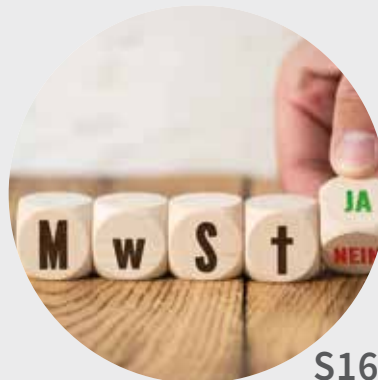
MwSt- Digitalpaket S16