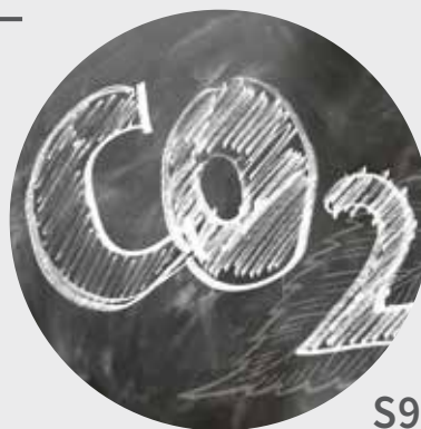
Carbon- Leakage S9