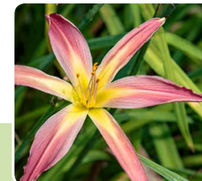
Viele Sorten zeigen eine dunklere Farbe (Band, Halo, Auge) in der Mitte. Rechts: Spider-Formen haben besonders lange, schmale Blütenblätter.