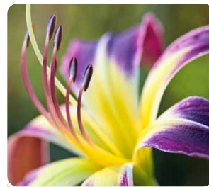
Typisch für Taglilie sind die nach oben gebogenen Staubfäden.

Mit den Stauden des Jahres 2018 holt man sich langlebige, auffallend blühende Grasbaumpflanzen ( Xanthorrhoeaceae ) in den Garten, die ihren deutschen Namen „Taglilie“ zu Recht tragen: Die einzelnen Blüten halten wirklich meist nur einen Tag. Dafür bilden die Pflanzen aber am laufenden Band immer wieder neue Knospen, und das über Wochen oder sogar Monate. Auch die Familienzugehörigkeit kommt nicht von ungefähr: Die Blätter erinnern wirklich an Gräser. Die meisten Arten stammen aus China und Ostasien. Dort werden sie seit Jahrtausenden kultiviert – und kommen sogar auf den Teller. Etwa die nussig schmeckenden Knollen von Hemerocallis fulva , aber vor allem die Blüten und Blätter, die bei allen Hemerocallis essbar sind. In Europa sind die prachtvollen Stauden erst seit dem 16. Jahrhundert bekannt. Im Garten erweisen sie sich als äußerst pflegeleicht und dankbar. Sie wachsen und blühen an fast jedem Standort zuverlässig und ohne großen Pflegeaufwand. Eine Schwierigkeit gibt es jedoch: Wie soll man sich angesichts der riesigen Auswahl (2015 waren international ca. 80.000 Sorten registriert) nur entscheiden können? Und die Züchter sind weiterhin emsig damit beschäftigt, haltbare neue Farbkombinationen, und vor allem reines Violettblau, Purpur, Rosa und Weiß zu kreieren.