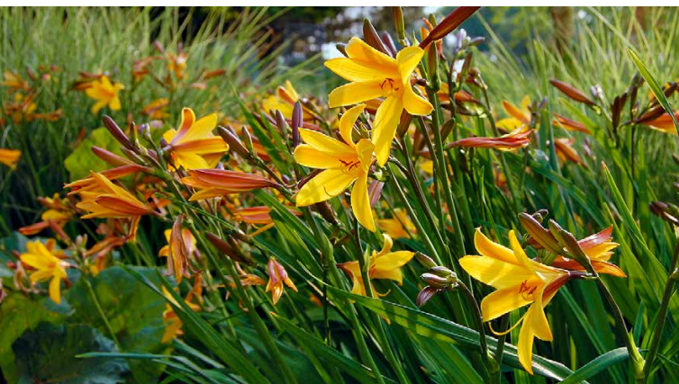
Vor allem Hemerocallis mit zierlicheren Blüten versprühen einen wildhaften Charme.