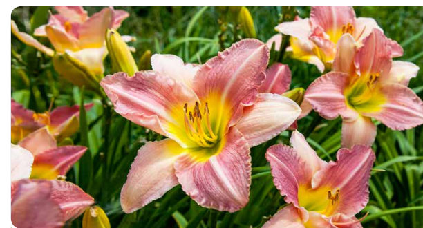
Rosatöne sind bei Hemerocallis erst durch intensive Züchtung entstanden. Unten: Mutterpflanzen braucht es in der Staudengärtnerei zur Vermehrung.

Für den bekannten Staudengärtner und -züchter Karl Foerster waren Hemerocallis die „Blumen des intelligenten Faulen“, da sie kaum Pflege brauchen. Gutes tun können Sie ihnen trotzdem, indem Sie ihnen im Frühling eine ordentliche (Voll-)Düngergabe verabreichen. Was den Standort betrifft, sind die Pflanzen recht anspruchslos. Sie wachsen fast überall, am besten jedoch auf nährstoffreichen, nicht zu trockenen Böden in voller Sonne bis lichtem Schatten. Im Schatten blühen die meisten Sorten nicht mehr zufriedenstellend. Sollten sich ältere Horste plötzlich blühfaul zeigen, ist es Zeit, sie zu teilen. So können Sie die Pflanzen gleichzeitig sortenecht vermehren. Die meisten Sorten lassen sich bei Bedarf ohne Probleme verpflanzen. Die üblichen sommergrünen Sorten sind absolut winterhart, die aus den USA stammenden (halb-)immergrünen nicht immer.