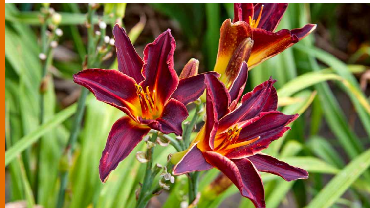
Klassische Sorten zeigen ungefüllte, trompetenförmige Blüten.