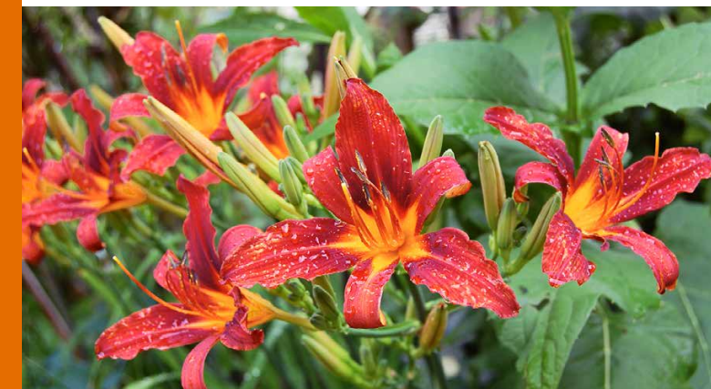
Auch wenn rote Blüten etwas regenempfindlich sind, am nächsten Tag öffnen sich neue!