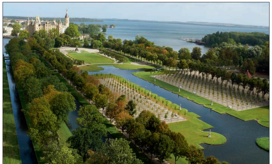
Erfolgsmodell in Sachen Grünpolitik: Bundesgartenschauen, hier der Schlossgarten der BUGA Schwerin 2009.