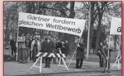
Energie war und ist Thema Nummer 1 im Gartenbau.