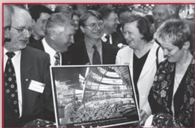
IPM 2001: Messerudgang